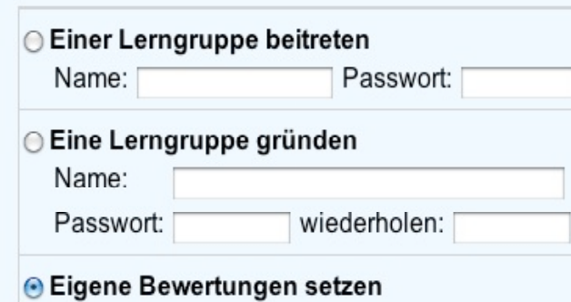
Bild 4: Vergabe der fünfstufigen Bewertung durch Anklicken der Kreise

Hier können Sie entscheiden, ob Sie eine Lerngruppe anlegen , sich einer Lerngruppe anschließen , oder eigene Bewertungen eingeben möchten.